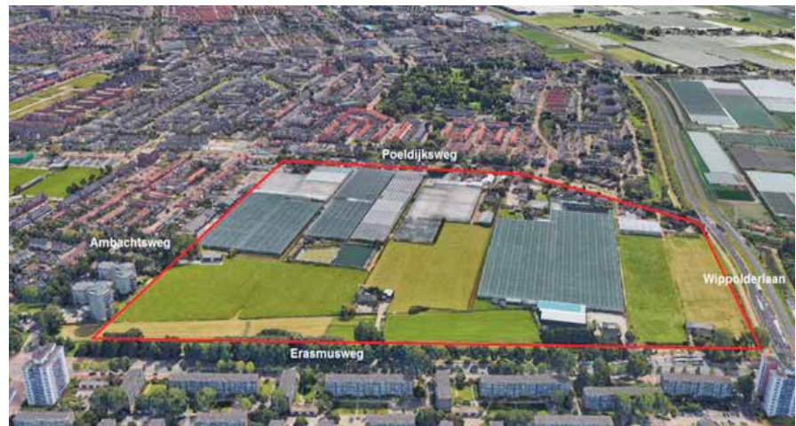
— globaal plangebied

Het transformatiegebied in Wateringen is circa 20 hectare groot en ligt tussen de Poeldijkseweg, Wippolderlaan, Ambachtsweg en Erasmusweg. Het gebied van ongeveer 28 voetbalvelden groot zal ontwikkeld worden als woonwijk. Om een samenhangende (woon)wijk te kunnen realiseren is het belangrijk een visie op te stellen voor het totale gebied. Het totale gebied is in eigendom van verschillende grondeigenaren die woningbouw willen ontwikkelen. Naast de gemeente zijn dit woningcorporatie Staedion, Weboma en BPD Ontwikkeling. In deze tweede nieuwsbrief informeren wij u over de stand van zaken.